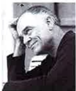
Denis de Rougemont